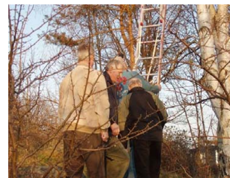
Här ser det trångt ut!