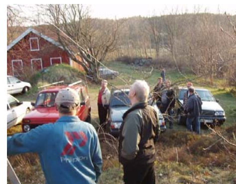
Kommer det att gå enligt planerna?