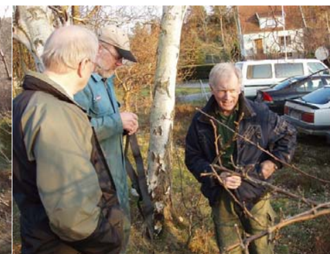
Men.. är det inte ett säkerhetsbälte?