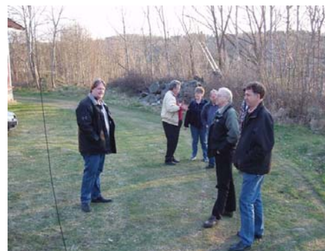
SM6XAT, DER, KAT, PID, RTN & EPW