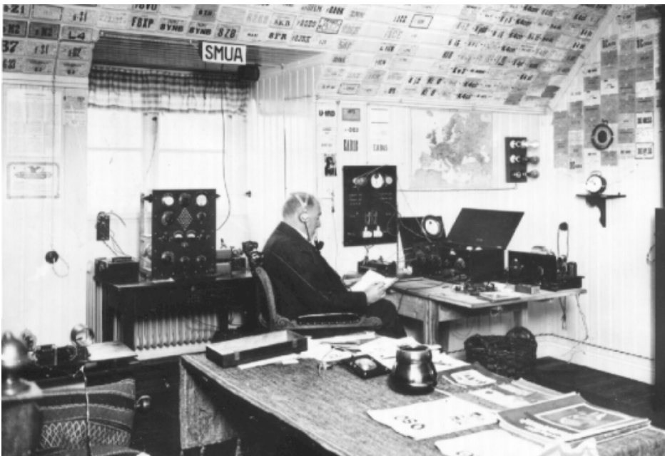
SM6UA John, februari 1928.