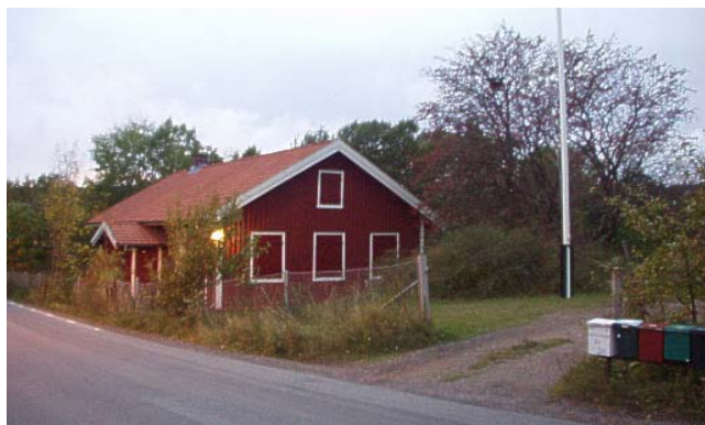
Omslagsbilden: Byggverksamheten har startat!