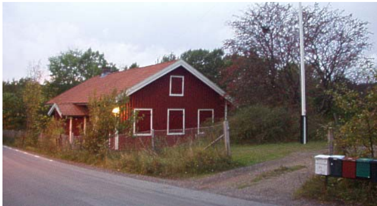
Omslaget: Läs mer på sidan 5 i detta nummer!

På månadmötet i december diskuterades bl.a. den uppkomna frågan om en frekvens på 80 m där vi kan träffas under t.ex. semestertider eller när man kanske inte når vår repeater.