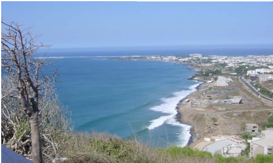
Vi bor på udden nästan längst upp.

En hel del har hänt sedan dess, men mer om det i kommande nummer av KRA-bladet.