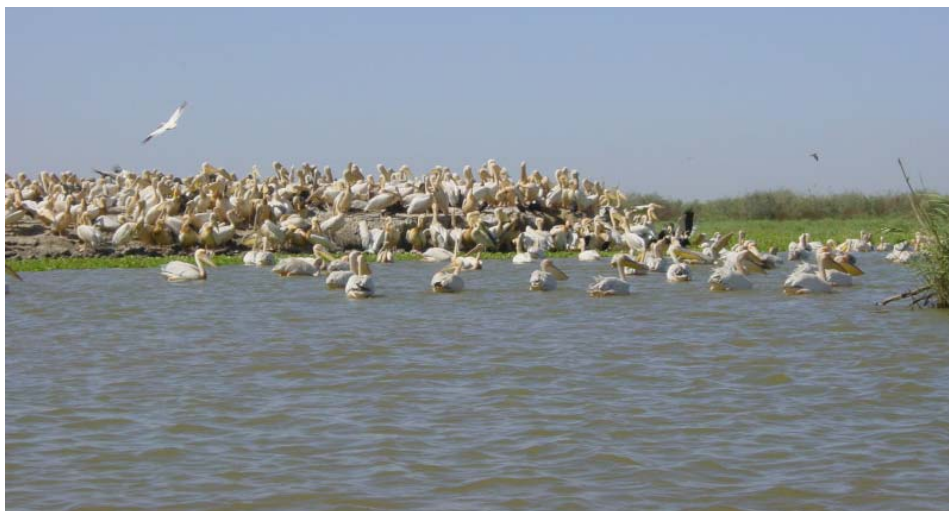
Senegal har numera inte så mycket stora djur. Fåglar finns det dock gott om. Här är en koloni med ca 10000 pelikaner. Dom luktade inte så fräscht om man råkade befinna sig i vindriktningen.