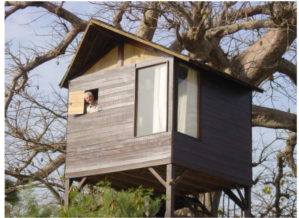
Vi har varit på en tur söderut med till ett märkligt landskap. Området heter Palmarin. På en originell lodge kan man bo antingen på pålar i vattenbrynet eller i en "koja" i de för Senegal så typiska Baubab-träden.